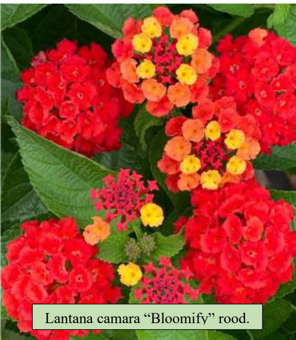
Lantana camara "Bloomify" rood.

Lantana's worden al lang bewonderd vanwege de lange bloeitijd. De kleurrijke bloemen zijn een verrijking voor de tuin. De plant kan in de volle zon staan, vraagt weinig onderhoud en groeit uitstekend bij voldoende vocht en voeding. Ze trekt bovendien vlinders en bijen aan. Deze lantana heeft een bolvormige groeiwijze, steriele bloemen en dus geen zaadproductie.