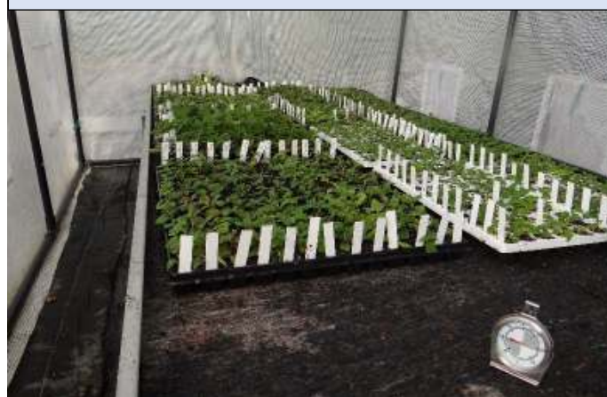
Jonge stekken in het voorjaar in een tunnelkasje.

Als stek gebruikt men de top van een fuchsiascheut. Deze top moet enkele centimeters groot zijn. Men snijdt met een scherp mes de stek vlak onder een bladpaar af en verwijdert