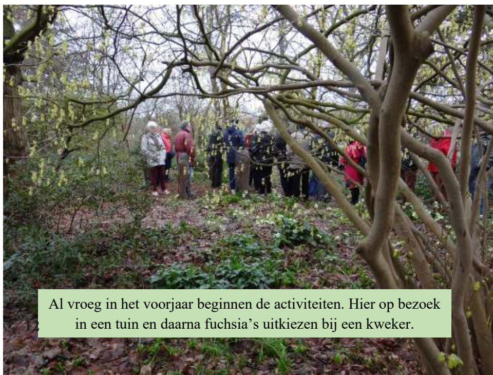
Al vroeg in het voorjaar beginnen de activiteiten. Hier op bezoek in een tuin en daarna fuchsia's uitkiezen bij een kweker.