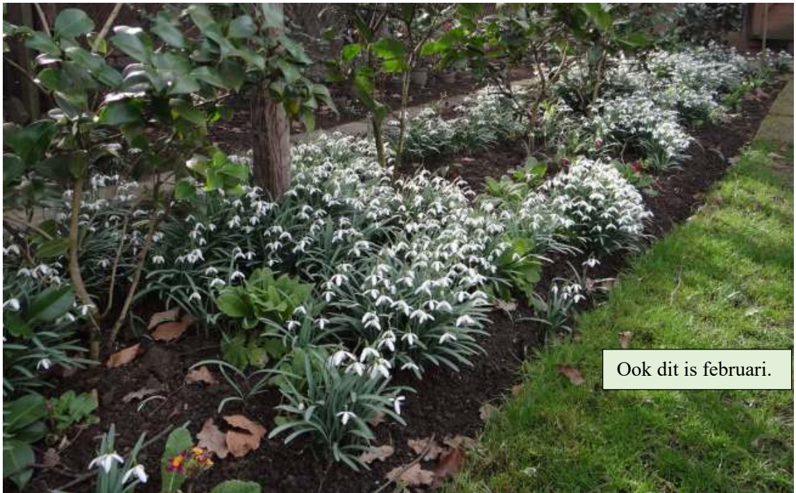
Ook dit is februari.

In februari kunnen nog bomen geplant worden waarbij men vooral moet letten op de ruimte die men voor de boom heeft. Planten wil ook zeggen vooruit kijken, want wanneer straks alles in volle groei en bloei is en de bomen en struiken groeien in elkaar, dan heeft men zijn doel niet bereikt. Planning hoort er ook bij en dat geldt niet alleen voor bomen, maar ook voor vaste planten in de border. Dat geldt