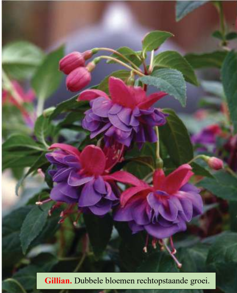
Gillian. Dubbele bloemen rechtopstaande groei.

Met een organische voeding kan men de planten moeilijk sturen omdat de organismen in de grond de voeding eerst moeten omzetten tot stoffen die door de wortels kunnen worden opgenomen. Minerale voeding wordt sneller opgenomen en dus reageren de planten ook sneller.