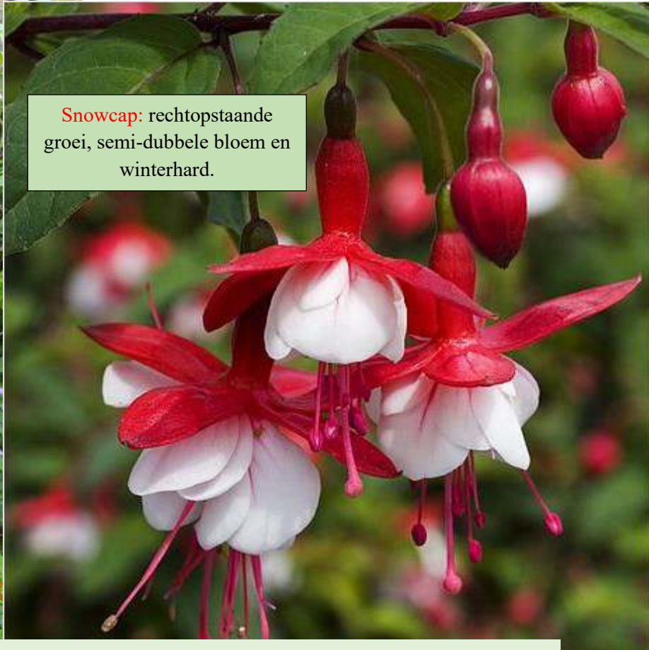
Snowcap: rechtopstaande groei, semi-dubbele bloem en winterhard.