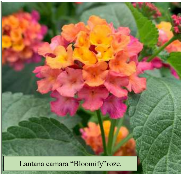
Lantana camara "Bloomify"roze.

Lantana's worden al lang bewonderd vanwege de lange bloeitijd. De kleurrijke bloemen zijn een verrijking voor de tuin. De plant kan in de volle zon staan, vraagt weinig onderhoud en groeit uitstekend bij voldoende vocht en voeding. Ze trekt bovendien vlinders en bijen aan. Deze lantana heeft een bolvormige groeiwijze, steriele bloemen en dus geen zaadproductie.